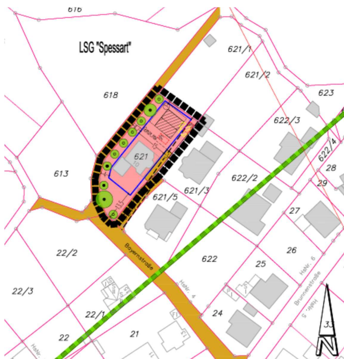
Abbildung 1: Übersicht des Planungsgebietes (Änderung des Bebauungsplans „Verlängerte Bayernstraße“ im beschleunigten Verfahren gemäß §13a BauGB, Johann und ECK).

Das Planungsgebiet befindet sich nordwestlich am Ortsrand von Eichelsbach der Marktgemeinde Elsenfeld direkt an vorhandener Wohnbebauung (WA). Nordwestlich und nordöstlich des Planungsgebietes schließen sich Wiesen mit vereinzelt Bäumen an. Weiterhin befindet