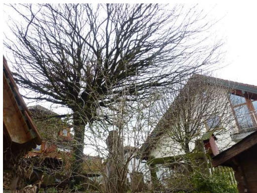
Kugelrobinie

Nachfolgende Bilder einen Teil des Baugeländes.