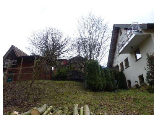
Zierkirsche

Es waren bereits bei Begutachtung vier Bäume direkt im bzw. an der Grenze des Planungsgebietes gefällt.