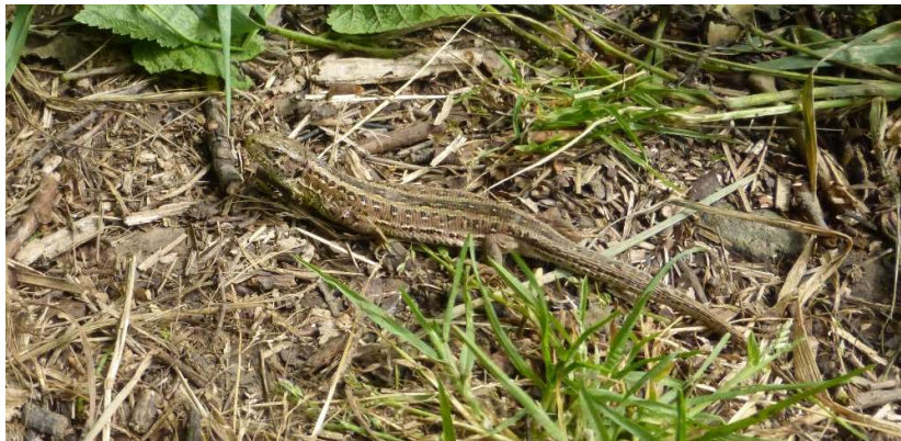
Zauneidechse ( Lacerta agilis )

NATURSCHUTZFACHLICHER BEITRAG hier: Artenschutzrechtliche Beurteilung Eingriffs- / Ausgleichsregelung