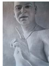
Sandra WÖRNER Zeichnungen