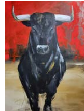
Sylvia KESTER Gemälde