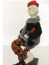
Monika GERLACH Skulpturen