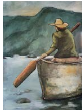
Gundula FLECKENSTEIN Gemälde