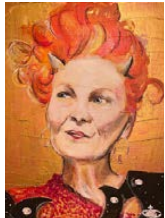
Petra BALONIER Gemälde

Music & Art im Bürgerzentrum | Eintritt frei