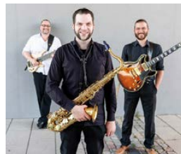
Jazz-Trio DINNERTONES Musik