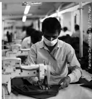
Fairtrade Deutschland e.V. / Siva Pawl

Info dazu, ob das Produkt aus einer Lieferkette stammt, in der existenzsichernde Löhne bereits erreicht wurden.