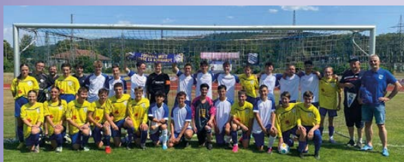
Fußballspieler aus Condé-en-Normandie und Elsefeld im Spessartstadion

Am Samstagnachmittag fand gleich das erste Freundschaftsspiel zwischen der Jugend aus Condé und aus Elsefeld statt. Am Sonntag gab es dann zwei weitere Spiele. Nicht nur wegen unserer Gastfreundlichkeit gewannen die Mannschaften aus Condé alle Spiele in U13, U15 und U17.