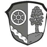
Illustration: Ten Brinke Architekten