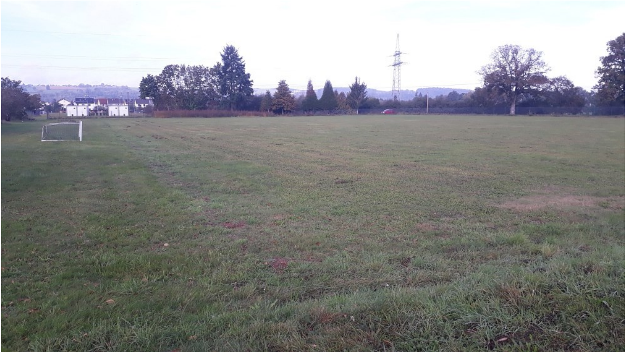
Rasenspielfeld -Blick nach Westen – sehr geringe Bedeutung als Lebensstätte