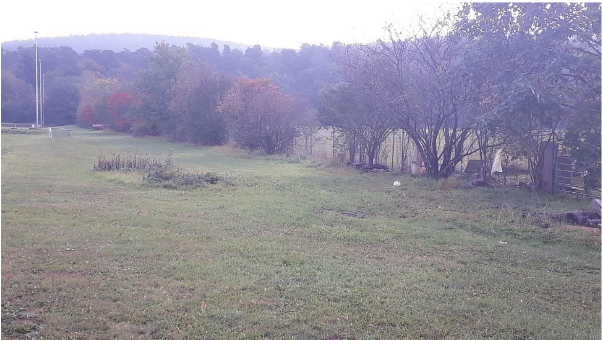
Gehölzstreifen im Süden – außerhalb des Eingriffsbereichs