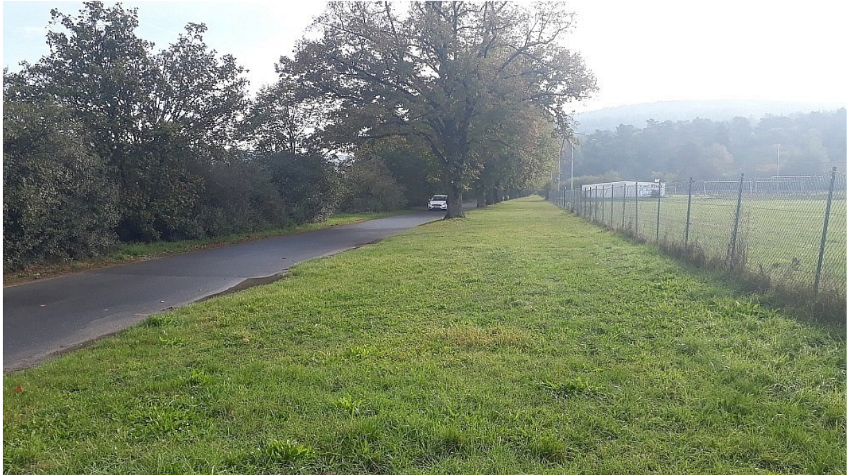
Grünstreifen mit Lindenreihe rechts des Wegs (zu erhaltender Bestand) – links Heckenzug (vorhandene Ausgleichsfläche außerhalb des Geltungsbereichs)