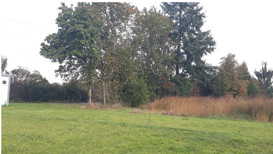
Gehölzgruppe im Westen (oben Ostseite, unten Westseite an Dammsfeldstraße) – mittlere Bedeutung als Lebensstätte