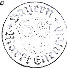
Matthias Luxem Erster Bürgermeister