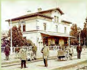
Bahnhof „Obernbürg“ 1892