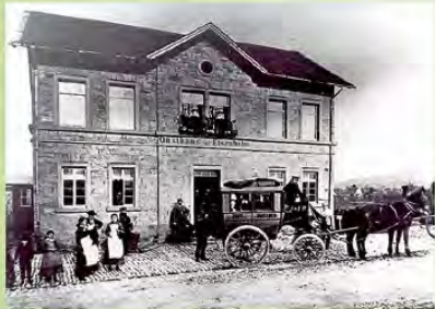
Gasthaus „Zur Eisenbahn“ 1896 mit Postkutsche

Unser Vereinsmitglied Rainer Schreck ist ein überregional anerkannter Modellbahnbauer. Bewundern Sie seine Modellbahn, die mit einer Länge von 5,5 m sehr realistisch die Elsenfelder Bahn- und Wohnanlagen aus den Jahren um 1876 im Maßstab 1:87 wiedergibt.