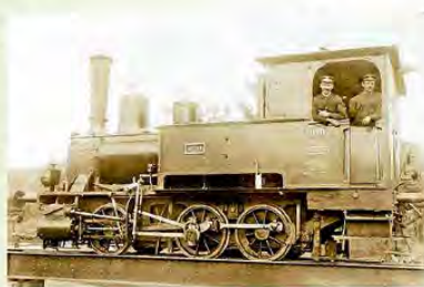
königlich bayrische Dampflokomotive ca. 1910

Nachbau des Elsenfelder Bahnhofs "Obernbürg" um 1876 als Modelleisenbahn in der Sonderausstellung. Als Station der königlich bayrischen Staatseisenbahn. Zu einer Zeit als die Eisenbahn noch das Fahren lernte und jedes Königreich seine eigenen Vorstellungen davon hatte.