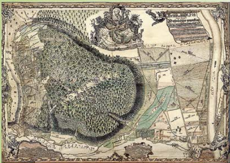
Die Karte von 1776 zeigt die Gemarkung Mainhausen

Mitte des 18. Jahrhunderts gab es Streitigkeiten um die Aufteilung der untergegangenen Ortschaft Mainhausen. Ein Glücksfall für uns, denn aus diesem Anlass wurde das Gebiet zwischen Elsenfeld und Erlenbach neu vermessen und eine sehr exakte Karte angefertigt. Dieses „Luftbild“ zeigt uns